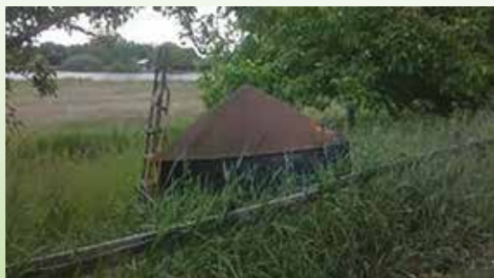
(Met dank aan Rinus Sinke)

“Interessant is hoe de boeren van dit verschijnsel gebruikmaakten. Via een lange buis (vaak van hout) met filter aan de onderzijde lieten ze het opborrelende diepe grondwater over een of meer cirkelvormige houten plateau's uitstromen. Bij deze uitstroming kwam het in het water opgeloste moerasgas (methaangas) vrij. Door nu over dat plateau een metalen kap te plaatsen konden men het gas opvangen. Via een buisje werd het gas naar de keuken gevoerd en gebruikt voor het koken. Tot in de jaren zestig van de vorige eeuw kwam deze wijze van aardgaswinning bij boeren in Noord- en Zuid-Holland voor. Vanwege