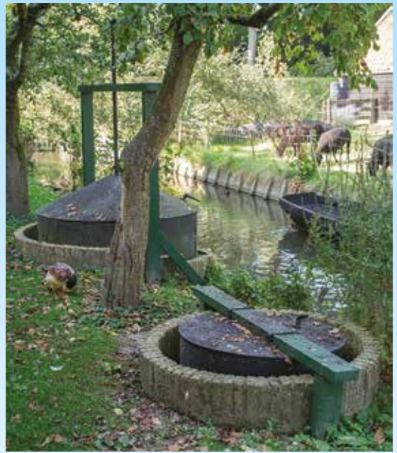
Figuur 2 Brongasinstallatie Zuiderzeemuseum

het hoge chloridegehalte en meegevoerde stikstofverbindingen werden deze bronnen door de hoogheemraadschappen verboden. Deze wijze van aardgaswinning was de aardgaswinning in Groningen dus ver vooruit. En er was nog een andere toepassing van kwel. Het opwellende water is namelijk met zo'n constante temperatuur van 11 graden C, uitermate geschikt om in de zomer de melk te koelen. De melkbussen werden dan in het kwelwater geplaatst.”