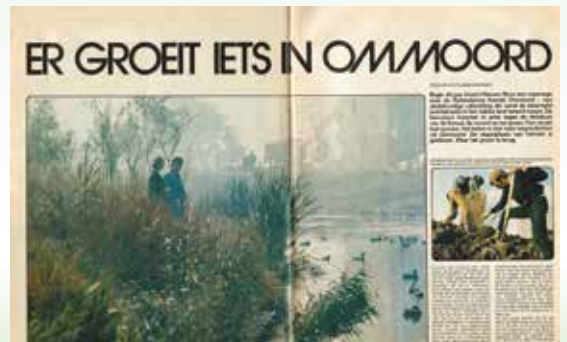
Nieuwe Revue 1972

Zoals wel vaker bij echt goede ideeën kwam de zaak in een stroomversnelling en al snel hadden de eerste 10 tot 12 vrijwilligers zich gemeld, de gemeente gaf het gebied de plan-naam 'Terrein voor experimentele groenaanleg', de initiatiefnemers kregen de vrije hand en de nodige deskundige ondersteuning van de toenmalige gemeente-